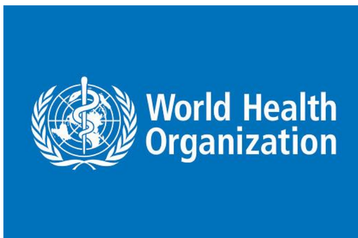
Slika 4: Svjetska zdravstvena organizacija(WHO)