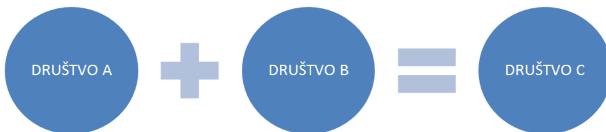
Slika 2 Grafički prikaz spajanja