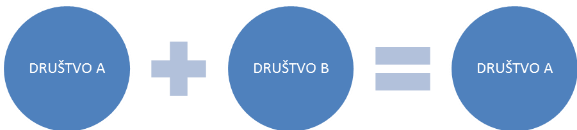
Slika 1 Grafički prikaz pripajanja

Izvor: obrada autora prema Pervan I. (2012) Računovodstvo poslovnih spajanja, Zagreb, RRIF plus d.o.o., str 8.