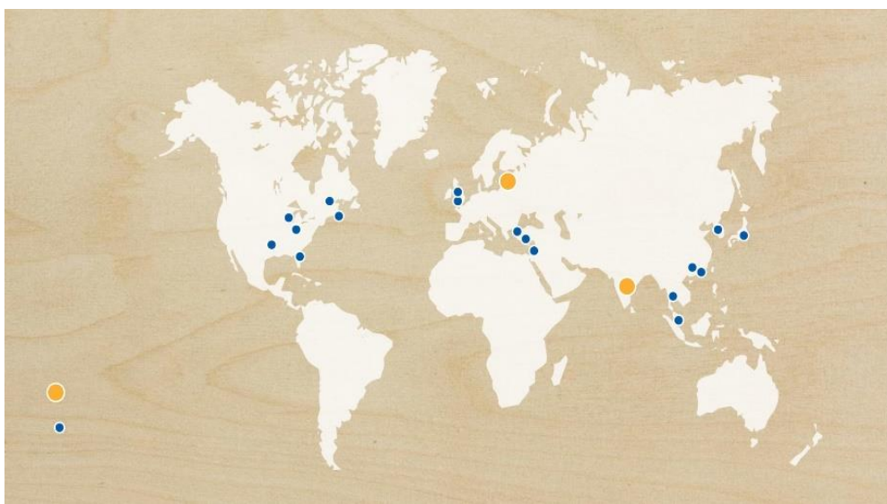
Slika 4. IKEA činjenice i brojke za 2018.