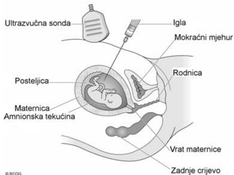
Slika 3. Amniocenteza

Punkcija se izvodi standardnom, tzv. spinalnom iglom duljine između 8 i 9 centimetara. Pod kontrolom ultrazvuka iglom se u ulazi u slobodni džep plodove vode i aspirira količina od 20 mililitara. Odmah nakon zahvata ultrazvukom se provjeri stanje fetusa, a šprica s plodovom vodom upakira se na propisani način za transport u citogenetski laboratorij. Nakon zahvata amniocenteze preporučuje se mirovanje sljedeća 24 sata i (ako je trudnica zaposlena) bolovanje u trajanju od sedam dana. Ponekad se dogodi da punkcija ne uspije nakon prvog uboda. Tada se, u dogovoru s trudnicom, punkcija može ponoviti bez, u literaturi opisanih, dodatnih rizika za trudnoću. Ukoliko zahvat ni tada ne uspije ili trudnica odbije ponovni ulazak iglom, on se odgađa za sedam dana.