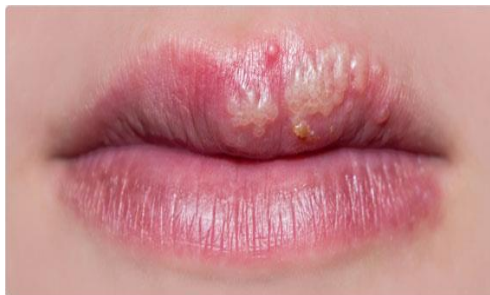
Slika 2. Herpes simpleks

Mjehuri se najčešće oblikuju u grozdove koji se udružuju u velika pojedinačna žarišta. Veličina nakupina može biti od 0,5 do 1,5 cm, a mogu se spajati. Promjene na nosu, ušima, očima, prstima ili genitalijama mogu biti izrazito bolne (Slika 2) (4).