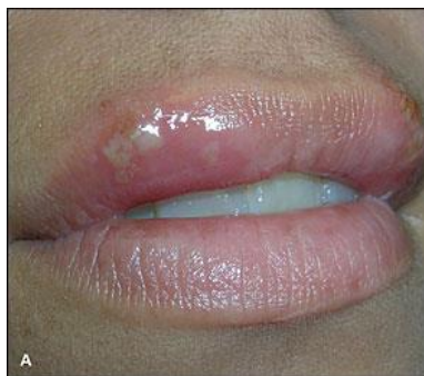
Slika 1. Herpes simpleks

Prije izbijanja herpes simpleksa javljaju se trnjenje, peckanje, nelagoda i svrbež što prethodi mjehurima nekoliko sati pa 2 do 3 dana. Mjehuri okruženi crvenkastim rubom mogu se pojaviti bilo gdje na koži ili sluznicama, ali najčešće u ustima i oko ustiju, na usnama i na spolnim organima (Slika 1) (4).