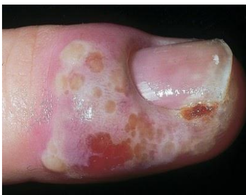
Slika 7. Herpetička paronihija

Otečene, bolne i eritematozne promjene na distalnim falangama prstiju posljedica su inokulacije HSV-a kroz kožu i uglavnom se susreće u zdravstvenih djelatnika (Slika 7) (1).