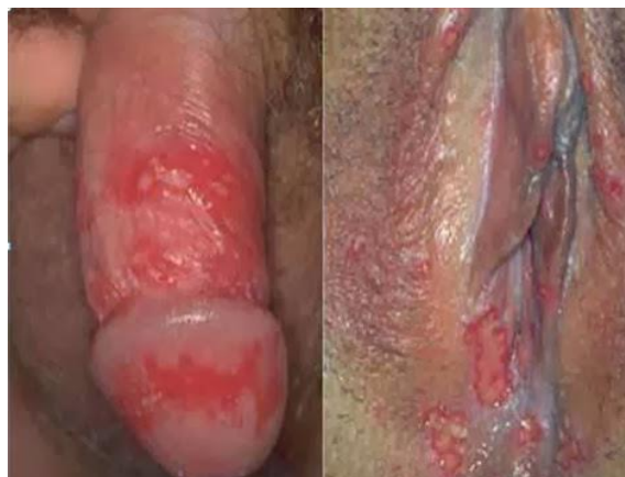
Slika 12. Genitalni herpes kod muškarca (lijevo) i žene (desno)