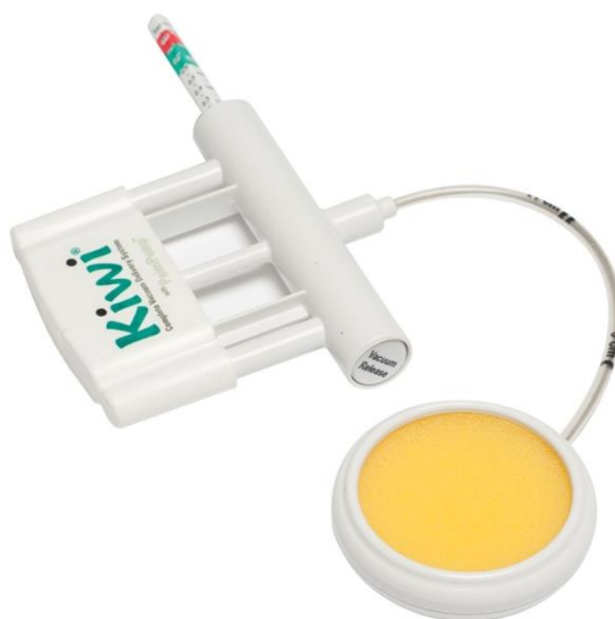
Slika 3. Kiwi vakuum sistem za pomoć pri porodu. Izvor [Internet]. Dostupno na: https://www.google.hr/search?q=kiwi+vakum&hl=hr&dcr=0&source=lnms&tbn=isch&sa=X&ved=0ahUKEwi3md6T8NvcAhWlzIUKHRZuDpEQ_AUICigB&biw=1366&bih=631#imgrc=9mDCHIWUbeIMqM:

Škotski profesor primaljstva James Simpson uveo je u praksu 1849. godine prvi klinički uporabljivi vakuumski ekstraktor. Bio je to metalni instrument zvonolikog oblika, pokriven kožom na cefalopelvičnom kraju. Mekani vakuum uveden je 1973. godine. Od tada se pojavljuju brojne izvedbe mekih, polurigidnih i rigidnih poklopaca izrađenih od različitih materijala (gume, plastike, spužve). U zadnje vrijeme proizvode se i rabe mekani silastični vakuumski ekstraktori s portabilnom ručnom vakuumskom crpkom i centralnim aplikatorom. Najpopularniji takav instrument je vakum Kiwi.