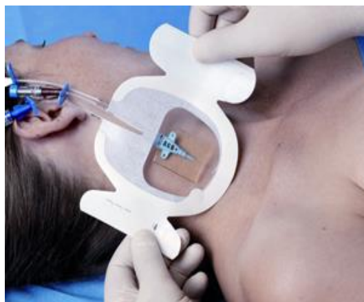
Slika 3. Prikaz 3M™ Tegaderm pokrivke za SVK

In vitro ispitivanja pokazala su da Tegaderm klorheksidin glukonat ( CHG ) gel pokrivka ima široko antimikrobno djelovanje protiv raznih gram-pozitivnih i gram - negativnih bakterija, gljivica, i mikroorganizama povezanih sa infekcijama SVK (48).