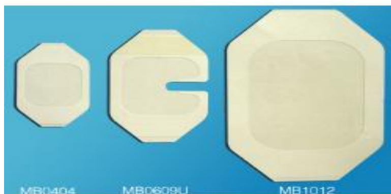
Slika 2. Prikaz „ klasične " pokrivke za SVK