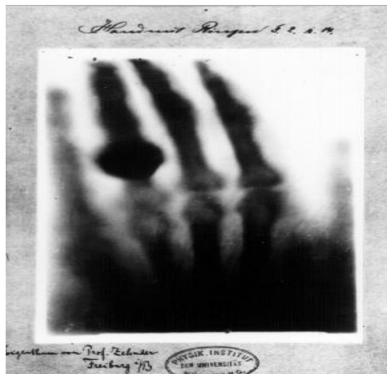
Slika 1. Prva rendgenska snimka-ruka Roentgenove žene Berte

Roentgen je nastavio s eksperimentima te je 22.12.1895 . tim novim zrakama snimio ruku svoje žene Berte.Snimanje je trajalo petnaest minuta.Tim događajem i datumom obilježavamo rođendan radiologije .