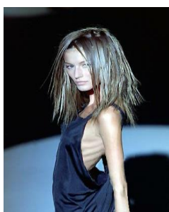
Slika 2. Model

Prema nekim podacima, poremećaji hranjenja se javljaju u oko 4 % adolescenata. AN je u posljednjem desetljeću sve češća, i to 20 puta više javlja kod djevojčica adolescentne dobi, nego kod dječaka (1). Prosječna dob početak bolesti je 17 godina, rijetko se javlja nakon 40. godine. Neki podaci upućuju na dva vrhunca, u dobi od 14 i 18 godina te je povezana sa stresnim životnim razdobljem, kao što je odlazak na studij (9). Prema nekim istraživanjima (9), smatralo se da je AN češća u višim društvenim slojevima. No, novija istraživanja (10) povezuju bolest s profesijama čiji je imperativ mršavost, kao što su balet i manekenstvo. Cjeloživotna prevalencija za AN iznosi 0.4-3.7%, a posljednjih godina je zabilježen njen porast među djevojčicama mlađim od 12 godina (10). Prevalencija kod žena u kasnijoj adolescentnoj i ranoj odrasloj dobi iznosi između 0.5-1%, a incidencija se povećala posljednjih desetljeća (9).