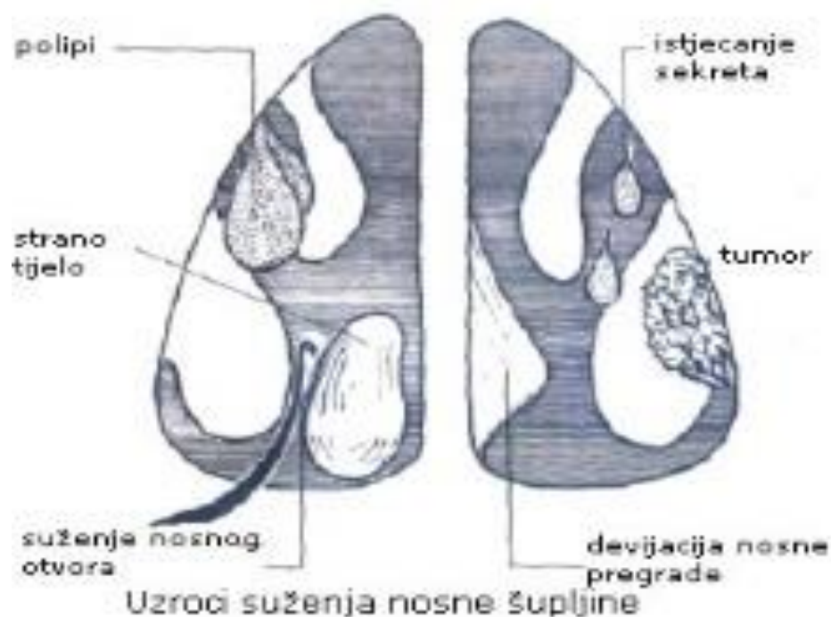
Slika 1. Uzroci suženja nosne šupljine

nerijetko susrećemo i druge patološke poremećaje (npr. septum nosa i polipi) koji dovode do komplikacija i problema u odvijanju normalnog rada receptora nosne šupljine, odnosno prirodnih i pravilnih funkcija respiratornog sustava (14). Premda je popis bolesti gornjeg respiratornog sustava veoma velik i dug u ovom radu se najčešće spominje devijacija septuma zbog relativno velike učestalosti i bitnog utjecaja na strujanje udahnutog zraka kroz nosnu šupljinu.