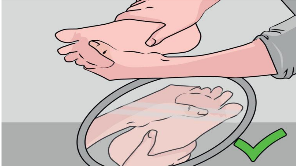
Slika 5. Pregled stopala uz pomoć ogledala