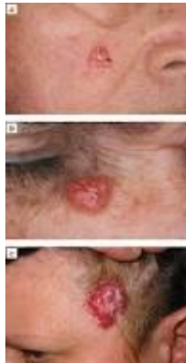
Slika 8. Cistični oblik

Basiloma cysticum se očituje u obliku papula ružičaste boje u području vjeđa (1).