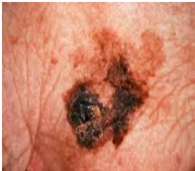
Slika 11. Lentigo melanoma

To je melanoma in situ obilježena prolongiranom radijalnom fazom rasta. Nakon nekog vremena može prijeći u invazivni melanom (LMM). LM se opaža u šestom ili sedmom desetljeću u osoba u kojih je izražena solarna degeneracija, ponajprije u predjelu lica. Očituje se neoštro ograničenom makulom u kojoj se mogu opaziti svijetlosmeđi, tamnosmeđi i crveni areali. Ne uzrokuje simptome, iako svrbež može upozoriti na početak vertikalne faze rasta (1). Pojava eleviranih areala upućuje na prelaz u LMM. Diferencijalan dijagnoza LM obuhvaća pigmentiranu seboroičnu keratozu, pigmentiranu aktiničku keratozu i solarni lentigo.