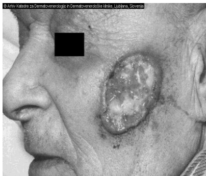
Slika 5. Ulcerozni oblik

Basalioma exulcerans se najčešće pojavljuje na koži, licu, uškama te potkoljenicama. Očituje se u obliku većeg ili manjeg ulkusa, koji često krvari te je pokriven krustama i granulacijama (slika 5). Diferencijalna dijagnoza mu je traumatski ulkus, a na potkoljenicama i hipostazički ulkus (1).