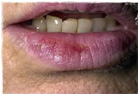
Slika 8. Planocelularni karcinom donje usne

1) na donjoj usni - pojava papula i erozija znak je tumora (slika 8.)