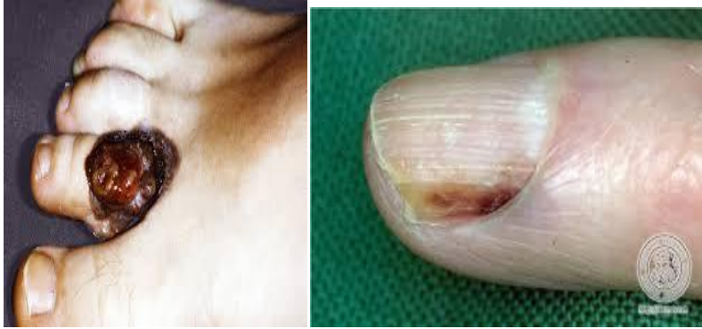
Slika 15. Akrolentigiozni melanom