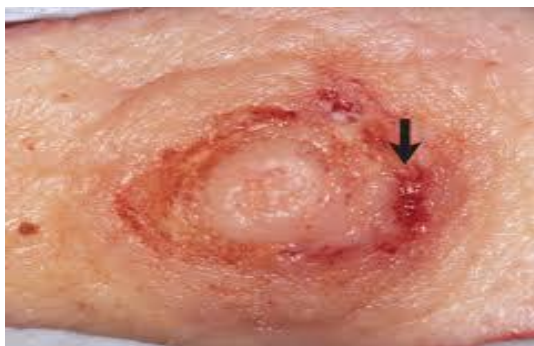
Slika 2. Pagetova bolest (mamarni oblik)

prekrivenim ljuskama ili krustama koje jednostrano zahvaća mamilu ili areolu dojke. Ulceracija, pojava čvora i osobito uvučenost mamile upozorava na invazivni karcinom. Promatrajući histološki nalaz u proširenom epidermisu možemo uočiti velike stanice svijetle citoplazme - Pagetove stanice. Dijagnoza se postavlja na temelju kliničke slike, potvrđuje histološkim nalazom. Pri pregledu je potrebno osobitu pozornost posvetiti stanju limfnih čvorova te postojanju tumorskih tvorbi u tkivu dojke. Diferencijalno - dijagnostički dolazi u obzir kontaktni dermatitis, psorijaza i karcinom in situ. Liječenje podrazumijeva kirurško liječenje, radioterapiju i/ili kemoterapiju (1).