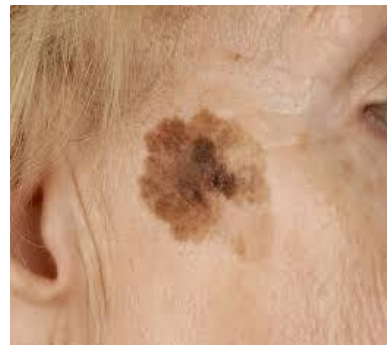
Slika 12. Lentigo melanoma