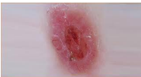
Slika 6. Superficijalni oblik

Basalioma superficiale ili površinko-šireći je baziloma koji najčešće nastaje na koži trupa, a može se uočiti i na udovima i licu u obliku eritematoznog, oštro ograničenog žarišta (slika 6.) Pojava ove vrste baziloma najčešće se povezuje s kroničnom ekspozicijom arsenu. Diferencijalna dijagnoza mu je Pagetova bolest, Bowenova bolest, psorijaza (1).