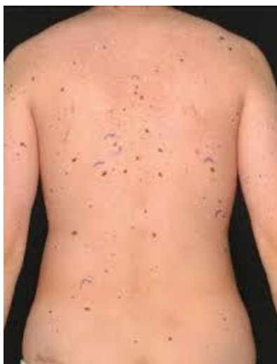
Slika 10. Sindrom displastičnog nevusa