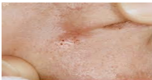
Slika 7. Morfeiformni oblik

Basalioma morpheiforme najčešće se pojavljuje na koži lica, nosa, čela i obraza u obliku atrofičnog ožiljka (slika 7). Lokalno je agresivan, sklon širenju u dublje strukture. Diferencijalna dijagnoza mu je dermatofibrosarkom (1).