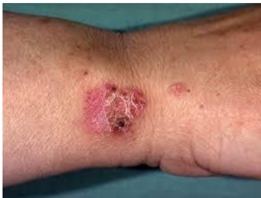
Slika 1. Morbus Bowen

KLINIČKA SLIKA: Bolest se najčešće očituje kao pojedinačni plak promjera nekoliko milimetara do nekoliko centimetara. Oštro je ocrtan, različita oblika. Obično je nešto uzdignut, površina je pokrivena sivkastim ili žutim ljuskama i krasticama (slika 1.) Rijetko se vidi ulceracija, ona upozorava na prelazak u invazivni karcinom. Bolest se može pojaviti na svakom predjelu kože ili na sluznici. Najčešće je smještena u predjelu lica, trupa ili u predjelu udova.