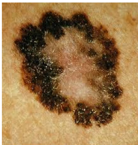
Slika 13. Površinsko šireći melanom

pojavu bjelkastih područja koja označavaju regresivne promjene. Diferencijalno dijagnostički moguća je klinička zamjena s pigmentiranim madežom (1).