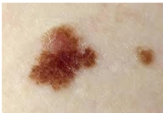
Slika 9. Displastični nevus

To je stečeni madež koji se obično pojavljuje nakon puberteta ili u odrasloj dobi. Postoje dva tipa: nasljedni i nenasljedni. Nenasljedni se javlja u sklopu sindroma displastičnog nevusa. Za nastanak ovog madeža nije odgovorna izloženost sunčevoj svjetlosti. Glavne karakteristike ovih madeža su : različiti oblici, česte bizarne forme; asimetričnost; tamnija pigmentacija; prisutnost papula i čvorića na površini; veličina obično veća od 5 mm; brži rast od normalnih madeža; nepravilni rubovi. Histološke karakteristike: različiti stupanj stanične atipije melanocita i proliferacija intraepidermalnih melanocita. Osobe koje imaju 10 i više displastičnih madeža na koži imaju 12 puta veći rizik pojave MM. Zbog nabrojenih karakteristika važnost ovih madeža očituje se u tome što postoji veliki rizik maligne alteracije u MM (1).