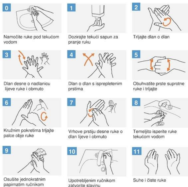
Slika 2. Postupak pranja ruku