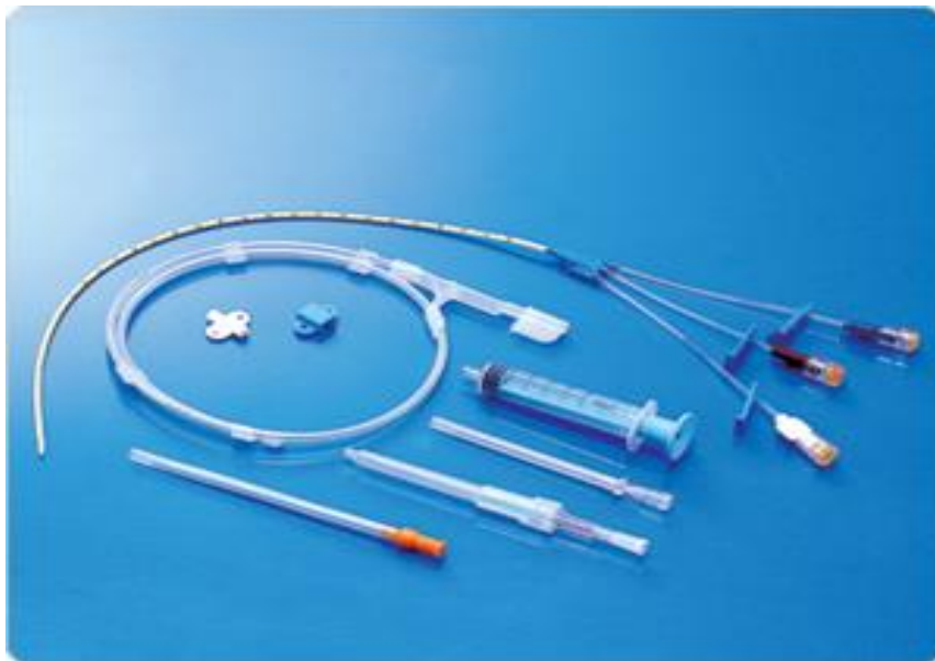
Slika 1. Prikaz seta za postavljanje SVK

Sestra dodaje liječniku : • sterilnu kompresu • sterilnu iglu i špricu u koju se navlači lokalni anestetik (lidokain) • set za SVK • sterilne šprice od 10 ml koje se ispune sterilnom 0,9%NaCl (15).