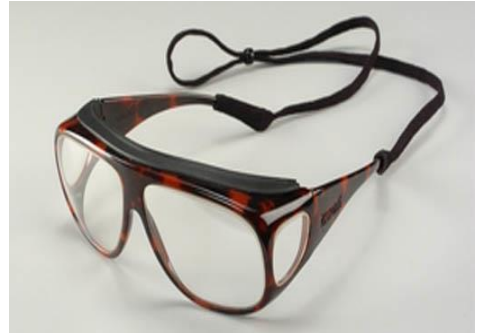
Slika 5. Zaštitne naočale