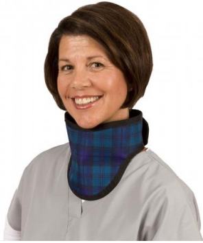
Slika 4. Štitnik za vrat

Zaštitne pregače i rukavice ne smiju se savijati, ne smiju biti oštećene, a njihova cjelovitost i ispravnost mora se redovito kontrolirati.