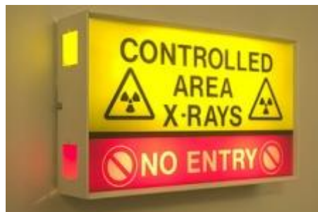
Slika 3. Svjetlo koje upozorava na trenutno korištenje zračenja

(b) zaključan, osim tijekom razdoblja u kojem je ulaz u područje potreban, s primjerenim nadzorom tijekom ulaska. Ispravnost signalnih uređaja i sustava međuprekidača mora se regularno provjeravati. Treba voditi računa i o rijetkim ali mogućim slučajevima kad treba voditi brigu i o djelatnicima izvan zgrade koji u blizini rendgenske prostorije obavljaju svoje zadaće (npr. čistačice, građevinski radnici i sl.).