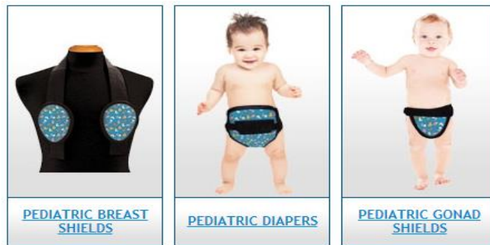
Slika 8. Štitnik za gonade i prsi djevojčica