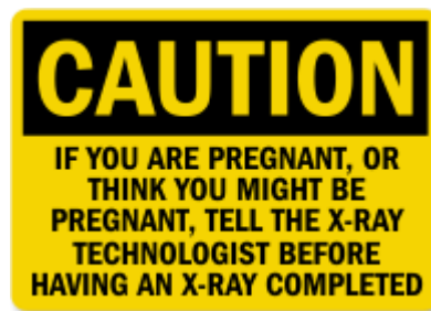
Slika 2. Upozorenje za trudnice

(1) Dijagnostički postupak uporabom radiofarmaceutskih pripravaka ne primjenjuje se na trudnicama i ženama koje doje, osim iznimno kad za neodgodivu primjenu tog postupka postoje opravdani zdravstveni pokazatelji po prosudbi doktora medicine odgovarajuće specijalnosti koji odobrava taj postupak, pri čemu utvrđuje uvjete provedbe tog postupka kojim će se osigurati najmanje moguće ozračenje pacijentice i djeteta, a da se pri tom dobiju dijagnostički podaci optimalne kakvoće.