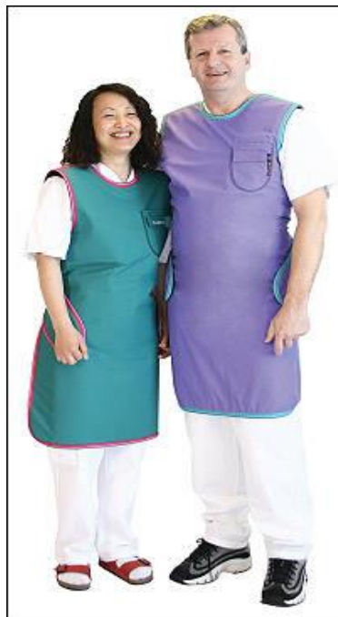
Slika 6. Zaštitne pregače