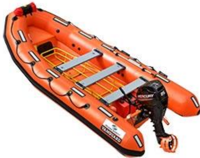
Slika 6 Spasilačka brodica

Motor im je vanjski, često benzinski, ali može biti i unutarnji dizelski motor. Sve su popularnije inačice s vodomlaznom propulzijom (engl. jet-drive ).