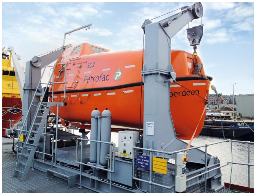
Slika 3 Nagibna gravitacijska soha

Nagibna gravitacijska soha (Slika 3) za inicijalno podizanje brodice iz početnog položaja koristi hidrauliku pokretanu vlastitim energetskeim sustavom. Nakon tog početnog pomaka, spuštanje brodice se odvija isključivo pomoću sile gravitacije koja djeluje na brodicu. Ukcavanje posade se odvija kada se brodica iz početnog položaja podigla hidraulikom do radnog položaja.