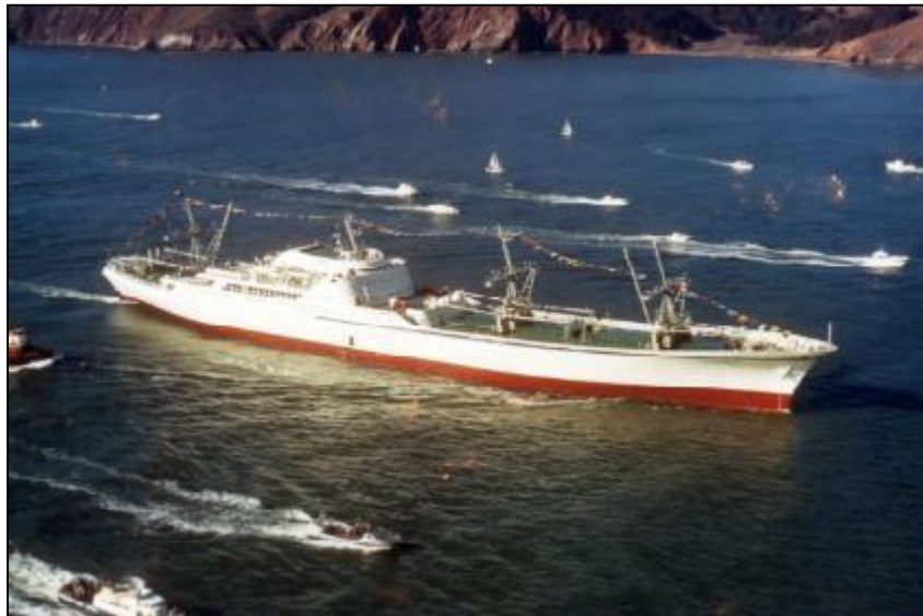
Slika 1. NS Savannah – revolucionarni brod na nuklearni pogon [21]

S ubrzanim razvojem tehnologije i tehnike gradili su se sve veći i moderniji brodovi, specijalizirani za prijevoz velikih količina pojedinih vrsta tereta, za prijevoz velikoga broja putnika, te za obavljanje drugih plovidbenih poslova. Također se razvija odobalna (off-shore) djelatnost, prvenstveno radi istraživanja i iskorištavanja podmorja (plovne platforme, objekti za polaganje cjevovoda i kabela na morskome dnu).