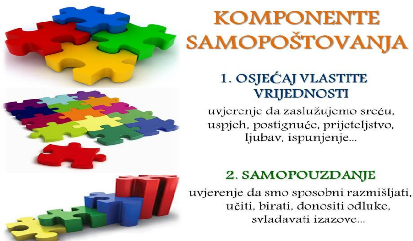
Slika 1. Komponente samopoštovanja [23]

Odgoj predstavlja važnu kariku u razvoju samopoštovanja. Odgoj djeteta započinje u obitelji. Uloga roditelja je od izuzetne važnosti. Roditelji bi trebali biti osobe koje cijene i poštuju sebe po mišljenju navedenom u [7].