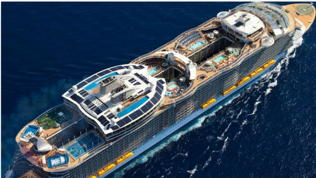
Slika 6. Specijalizirani brod za kružna putovanja