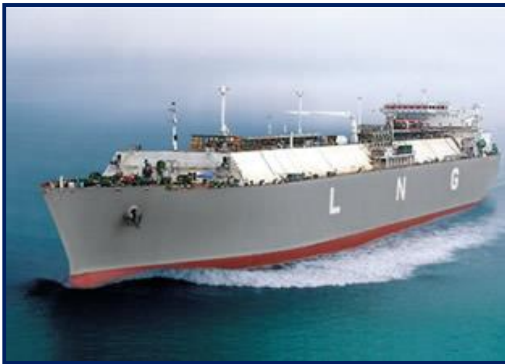
Slika 5. Specijalizirani brod za prijevoz ukapljenog plina