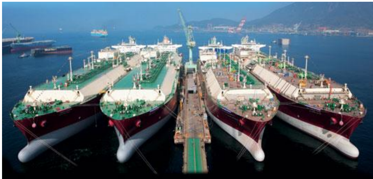
Slika 2. Flota za prijevoz tereta na tržištu pomorskog prijevoza

U nastavku rada pomnije je obrađeno teretno brodarstvo te vozarine koje vrijede u teretnom brodarstvu.