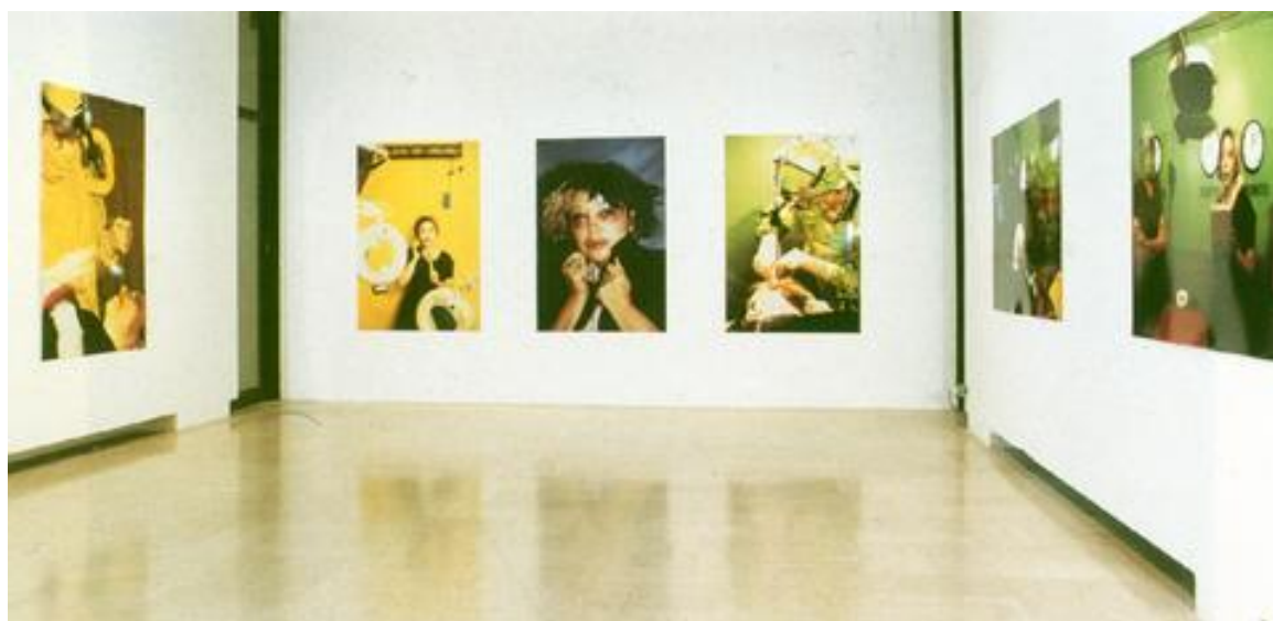
Slika 4 Orlan, Reinkarnacija svete Orlan ili slika, nove slike, izložba fotografija, 1990