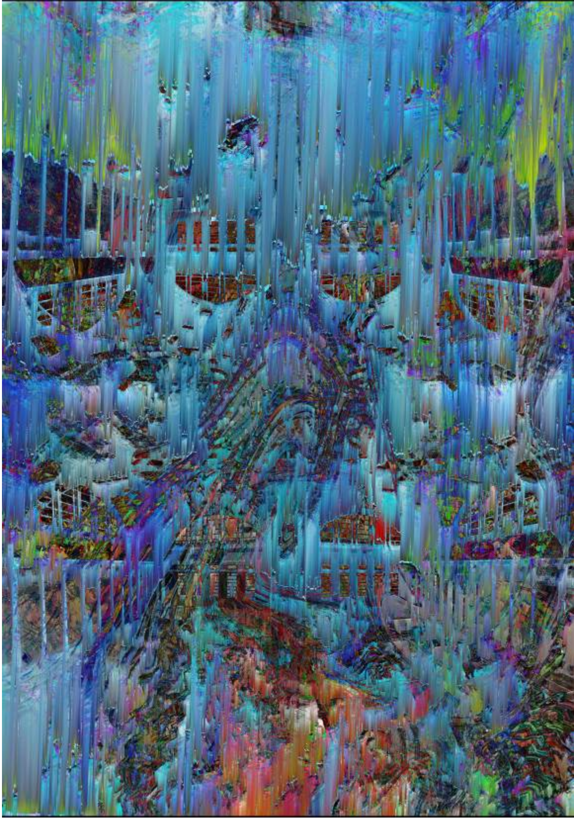
Kristijan Vrdoljak, Tvornica, 2021, digitalno generirana slika