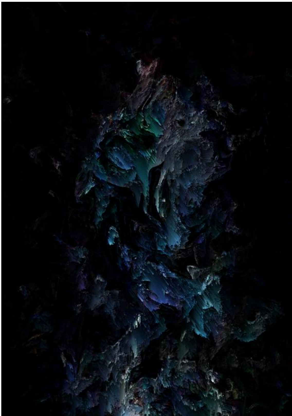
Kristijan Vrdoljak, Autoportret, 2021, digitalno generirana slika